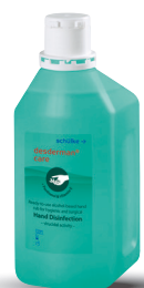
desderman ® care Réf. 1L : 70002057