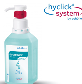
esemtan® wash lotion Hyclick Réf. : 7000133