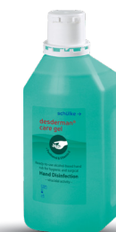
desderman ® care gel Réf. 1L : 70002356