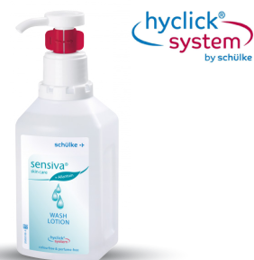
sensiva® wash lotion Hyclick Réf. : 7000137