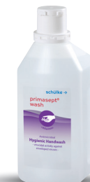
primasept ® wash Réf. 1L : 70002404