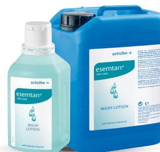
esemtan® wash lotion Hyclick Réf. 1L : 116602 Réf. 5L : 116604