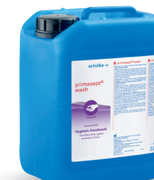
primasept ® wash Réf. 5L : 70002405