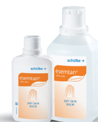
esemtan® dry skin balm cream Réf. 150 mL : 70000985 Réf. 500 mL : 70000843