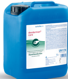
desderman ® care 5L Réf. 70002343